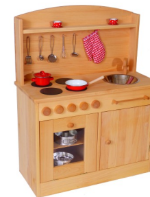
Kinderküche 2024 / K 2024