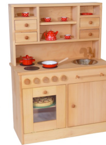
Kinderküche 2011 / K 2011