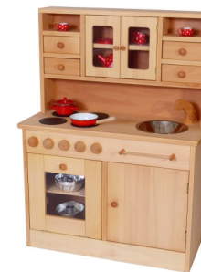
Kinderküche 2013 / K 2013