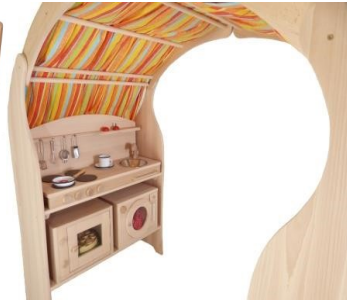
Spielständer 1010, 1011, 1020, 1021 mit Zubehör